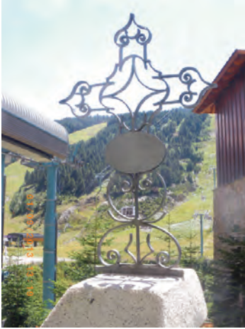
Vista actual de les pistes d'esquí de Soldeu des del cementiri on es troba enterrat Miquel Baró i Puigdemassa, traspassat el 25 de gener del 1973